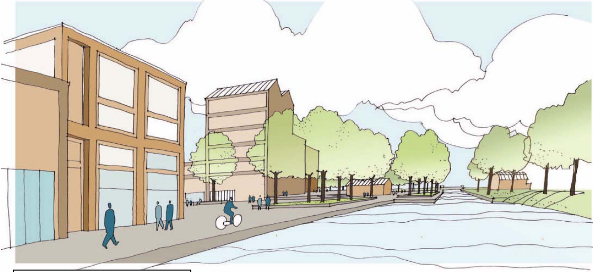
Zicht op traject 2 richting sluis